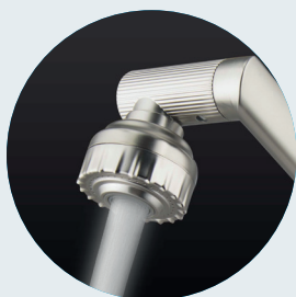
Napowietrzony Bubble mode