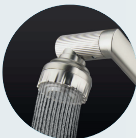
Prysznicowy Shower mode